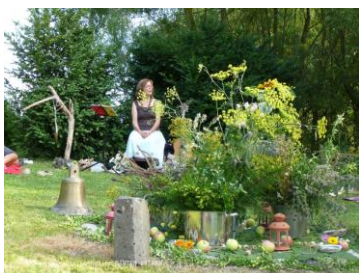
Märchen zu den vier Elementen