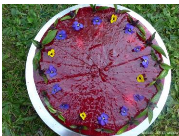
Torte mit Symbol zum Märchen