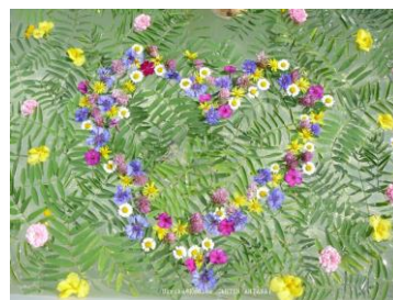
Herz für eine Hochzeitfeier