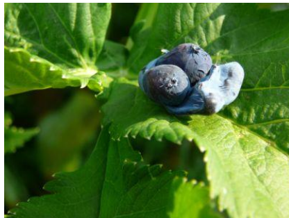
Maibeere, Honigbeere das erste Obst im Garten