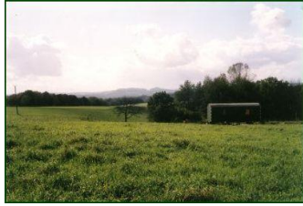
So fing es an 2001