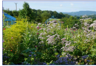
11 Jahre später 2012