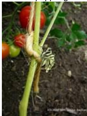
Frisch entpuppt noch zerknittert