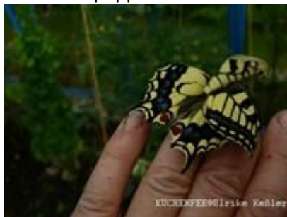
mit weichen noch gerollten Flügeln