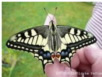
Schwalbenschwanz Startklar für den ersten Flug

Der Finger einer Garten-Besucherin durfte hier Startrampe für den Abflug sein.