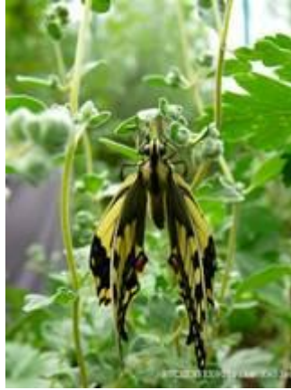
Beim Aufpumpen der Flügel

Auf Ihren Besuch oder auf ein Wiedersehen freue ich mich!