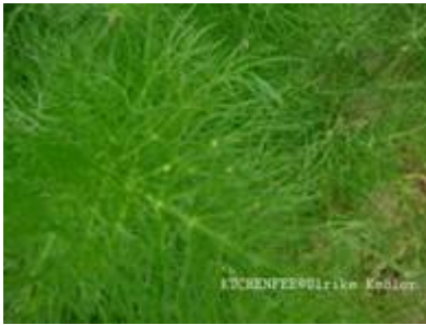
Eier vom Schwalbenschwanz