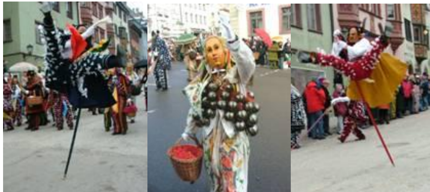
Diese drei Fotos sind vom Narrensprung in Rottweil.

Herzliche Grüße sende ich Ihnen in die Zeit der Winteraustreibung, der Narrensprünge, des Karnevals, der Faschingszeit und bald Fastenzeit. Ihre Ulrike Keßler