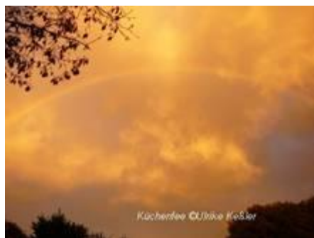
Abendhimmel über dem GARTEN ANTANA