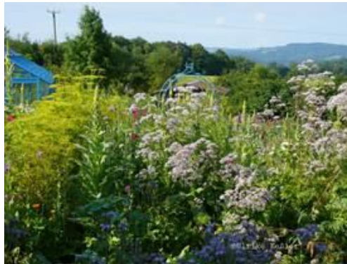
GARTEN ANTANA Samenfülle zum Verteilen